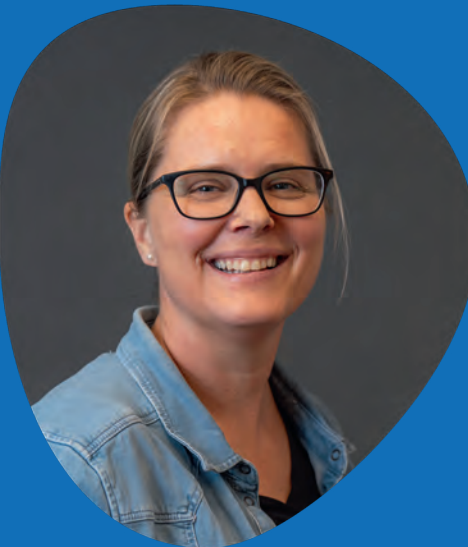
Bejanca van Grootheest Communicatie